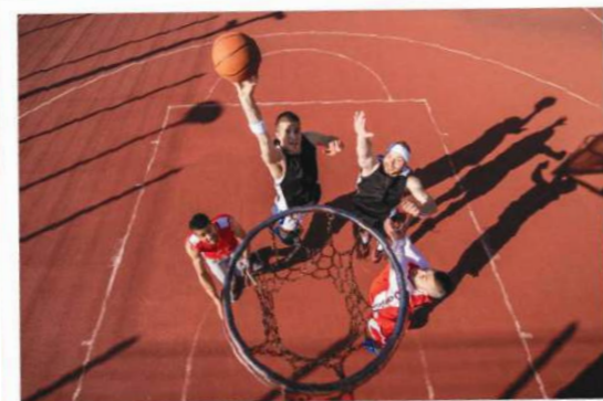
Tu talento deportivo también abre oportunidades 🏀