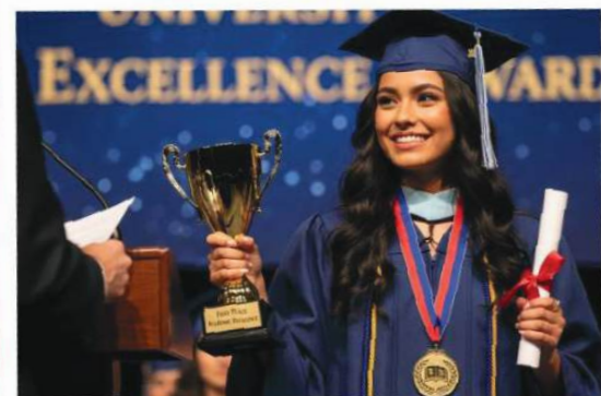
Reconocemos tu esfuerzo académico 🏆