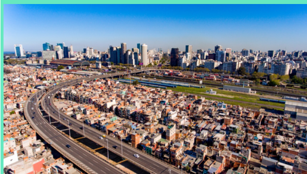
Vista aérea de Villa 31

La Integración Urbana y la Inclusión Social son paradigmas asimilados hace varias décadas para el diseño de políticas públicas. Al hacer una revisión de algunos programas de inversión en América Latina, llama la atención la manera como se incorporan estos conceptos en ciertas intervenciones en materia de Vivienda, Hábitat y Servicios Públicos, interesando destacar el papel que juegan la Arquitectura y el Diseño Urbano.