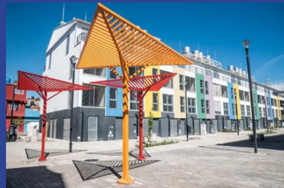
Viviendas de sustitución en Villa 31, en el sector "Costanera" (1.152 viviendas)

Otra importante intervención del Programa se refiere a la relocalización de familias que habitan en condiciones vulnerables e inseguras debajo del Puente illía, el viaducto que atraviesa el barrio a lo largo de 1,5 km. Se ha previsto y ejecutado la construcción de 1152 nuevas viviendas dentro de la misma Villa, las ya cuales se encuentran habitadas por las familias relocalizadas.