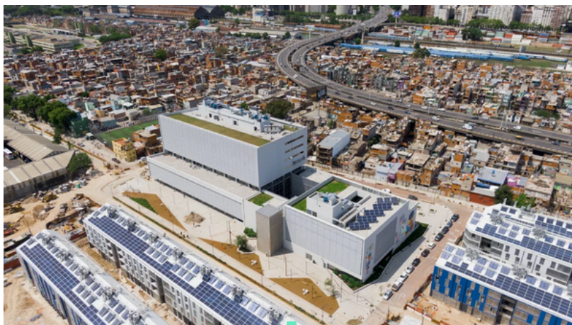
Edificio Sede del Ministerio de Educación de la CABA (21.000 m2).

Las autoridades de la CABA han decidido no sólo proveer servicios de infraestructura y equipamiento, sino establecer dentro de la Villa a la sede del Ministerio de Educación, un edificio de oficinas de 21.000 m2 donde se diseñarán las políticas educativas para toda la ciudad.