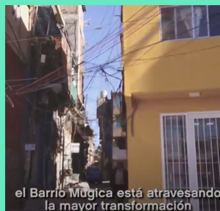
el Barrio Mugica está atravesando la mayor transformación

El gobierno de la Ciudad Autónoma de Buenos Aires, manifiesta que la intervención urbana integral en Villa 31 (Barrio Mugica) tiene entre sus objetivos principales que sus habitantes tengan los mismos derechos y responsabilidades que los demás habitantes de la ciudad.